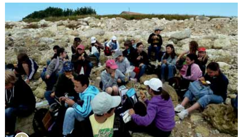
Pause goûter sur l'île d'Aix

Une magnifique aventure au cours de laquelle les enfants ont révélé tout leur talent et dont il restera des souvenirs à foison et un refrain gravé dans les annales de l'école : On n'est pas des imbéciles, On en a dans le ciboulot, À l'école du Fief, à l'école du Fief, À l'école du Fief Arnaud.