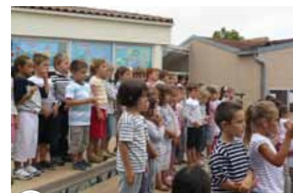
La Chorale des Crevettes présentée lors du spectacle de fin d'année.

♦ Sans oublier, évidemment, la Chorale des Crevettes présentée lors de la fête de l'école à la fin du mois de juin qui s'est poursuivie par des jeux organisés par les parents d'élève.