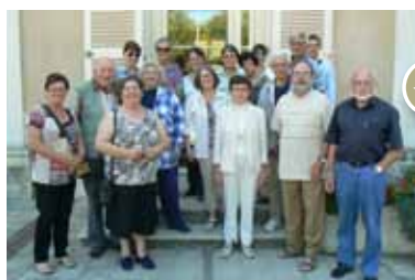
Le 30 juin dernier, les membres de la commission municipale chargée de l'Enfance et de la Jeunesse et les associations de parents d'élèves (AIPE, FCPE) recevaient les bénévoles de l'aide à la scolarité afin de les remercier pour leur soutien auprès des enfants et des collégiens durant l'année scolaire.

En tout ce sont plus de 33600 euros de travaux qui ont été réalisés en deux mois.