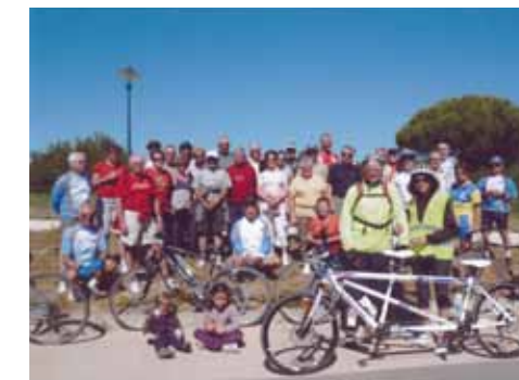
cyclistes d'un jour et cyclistes de toujours ont participé à une journée à la fois conviviale et sportive

Depuis plusieurs années ces aficionados de la petite reine se donnent rendez-vous de façon hebdomadaire sur le parking de l'espace Michel Crépeau pour pratiquer le cyclotourisme en groupe. Mais le dimanche 29 mai dernier en partenariat avec la municipalité, ils ont organisé deux circuits de 10 et 18 km, ouverts à tous, dans le cadre de la Journée Nationale du Vélo. Quarante participants ont pu découvrir ou redécouvrir les sites magnifiques qu'abrite notre commune comme les chemins côtiers, les pas qui vous mènent à la mer, l'Abbaye de Sermaise, et la route qui descend du Calvaire et qui laisse entrevoir un panorama surprenant de notre ville.