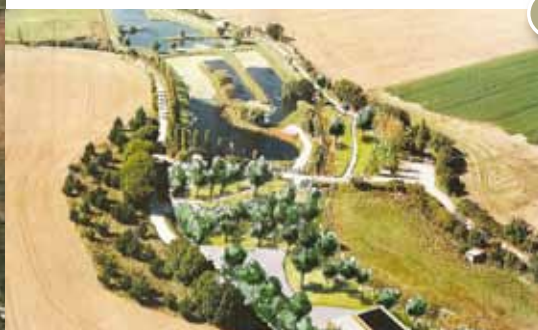
Croquis général du site après aménagement final