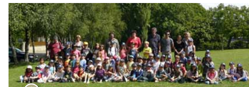
Classe verte pour les plus jeunes qui n'ont pas craint « le Loup Garou » et en haut photo souvenir pour les jeunes parisiens en herbe

parents (AIPE, FCPE), de la municipalité, qui tous ensemble, ont permis aux élèves d'apprendre, de vivre ensemble et de découvrir.