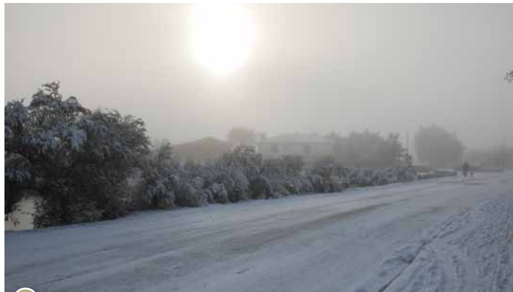
hiver 2010 : la neige surprend la commune

Le risque de submersion est également important sur la commune comme sur toute la frange littorale. La submersion résulte de la conjonction de plusieurs phénomènes : un coefficient de marée élevé et une pleine mer, des vents violents venant de l'ouest et une surcote.