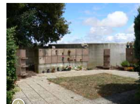
Des travaux de « voirie » vont donner au site cinéraire un aspect plus propre et plus respectueux des défunts et de leur famille

L'étape suivante consistera à aménager l'ensemble du site cinéraire et à augmenter sensiblement sa capacité d'accueil.