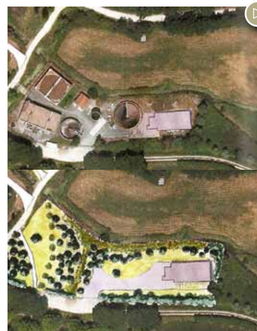
Bâtiments actuels de la station d'épuration (le nouveau bâtiment est dessiné à droite)

s'assécher. Cela va permettre de les curer pour enlever les boues qui s'y sont accumulés. Ils retrouveront ensuite un nouveau rôle épurateur mais cette fois-ci pour les eaux pluviales. En effet, le Gô collecte toutes les eaux pluviales du bourg et les amène dans le marais sans aucun traitement préalable. Pourtant ces eaux qui ont ruisselé sur les toitures et la voirie contiennent des traces d'hydrocarbures et des bactéries fécales. La Communauté d'Agglomération projette donc de construire une station de pompage qui fera passer les eaux du Gô dans les deux bassins de lagunage, afin de les traiter avant de le rejeter. L'ensemble du site bénéficiera d'un aménagement paysager avec des essences locales.