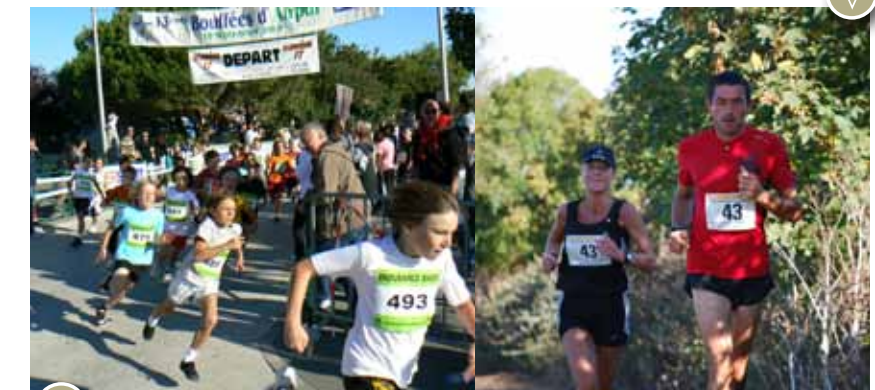
Rondes d'Airpur : petits mais très motivés !