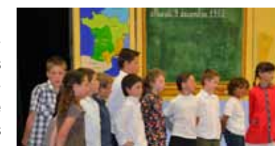
les enfants ont offert en fin d'année un spectacle théâtral de grande qualité