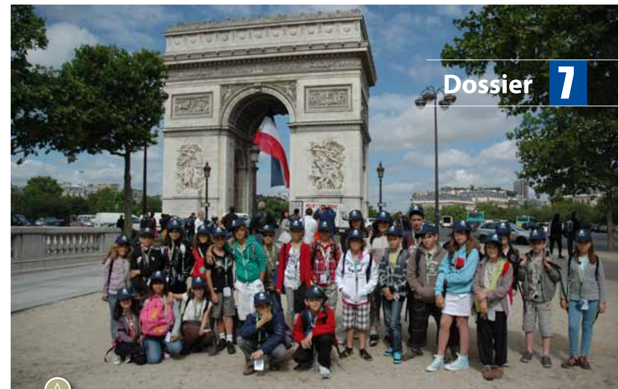
photo souvenir pour les parisiens en herbe de l'école Chobelet

Qui n'a jamais rêvé de devenir comédien, de monter sur scène ? Durant deux semaines, l'école du Fief s'est transformée en compagnie théâtrale. D'atelier en atelier, chacun a appris à améliorer sa diction, à nuancer l'intensité de