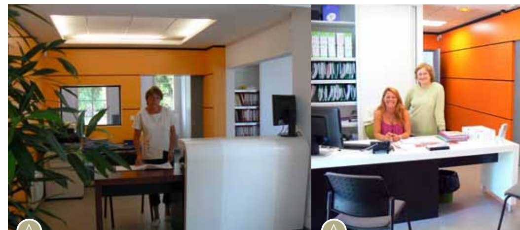
Le nouvel accueil de la direction des services techniques et de l'urbanisme