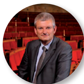
Monsieur Olivier Falorni, Député de la 1 ère circonscription de la Charente Maritime.

Rendez-vous par téléphone à l'accueil de la mairie : 05 46 37 40 10.