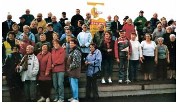
En 2009, s'est tenue à Nieul-sur-Mer la première rencontre interclubs des Aînés Ruraux auquel appartient le Club des Blés d'Or.

Au côté de la structure communale, il y a aussi des associations comme le Club des Blés d'Or qui tous les mardis et jeudis après-midi permet à nos aînés de se retrouver, tout simplement ou pour quelques activités (Club des Blés d'or, les mardis et jeudis à la Maison des associations, tél. 05 46 31 69 53)