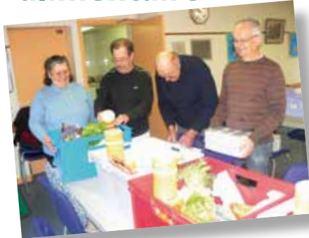
Préparation des colis pour la distribution de la Banque alimentaire

La collecte nationale de la Banque alimentaire qui s'est déroulée les vendredi 27 et samedi 28 novembre derniers dans le hall du magasin Intermarché de Nieul-sur-Mer a remporté un très vif succès. Ce sont ainsi 2,165 tonnes de denrées qui ont été collectées soit 370 kg de plus que la précédente collecte d'hiver. Un grand merci à nos bénévoles mais aussi à tous les généreux donateurs ! Nous vous donnons rendez-vous pour la prochaine collecte les 6 et 7 mai 2011. Nous avons besoin de vous. Merci.