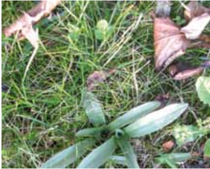
Les « rosettes » n'apparaissent pas tous les ans au même endroit