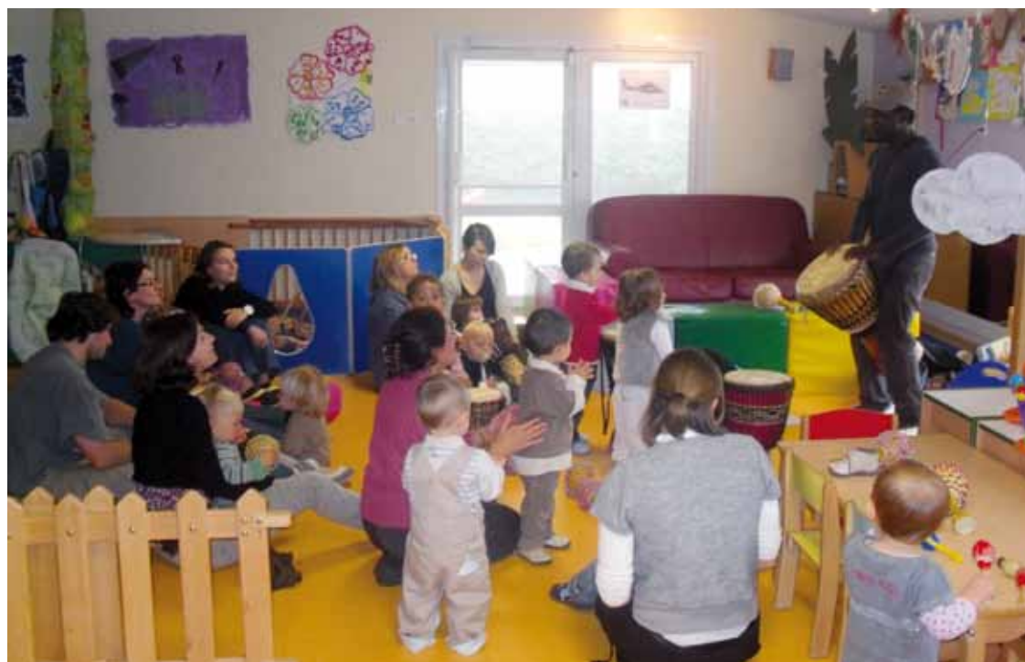
Des ateliers divers et variés offrent aux tout-petits un cadre propice au jeu et à l'éveil

Horaires d'ouverture de 7h30 à 18h45, du lundi au vendredi Horaire de la halte-garderie de 8h30 à 11h30 et de 14h00 à 18h00, du lundi au vendredi