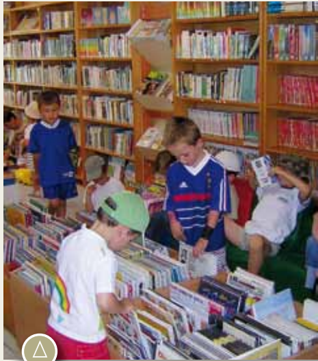
BD, romans jeunesse, documentaires, tout est là pour sensibiliser les plus jeunes au plaisir de lire

Appel aux écrivains Nieulais : Si vous êtes auteur de poésie, de nouvelles ou de romans et que vous avez déjà été publiés, vous pouvez vous faire connaître auprès du service Culturel de la commune (Rens. 05 46 37 40 10) qui organise un rassemblement des auteurs nieulais à l'occasion de l'anniversaire de la bibliothèque.