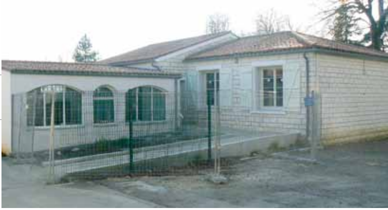
Le CCAS et la DST s'installeront courant mai dans l'annexe de la mairie