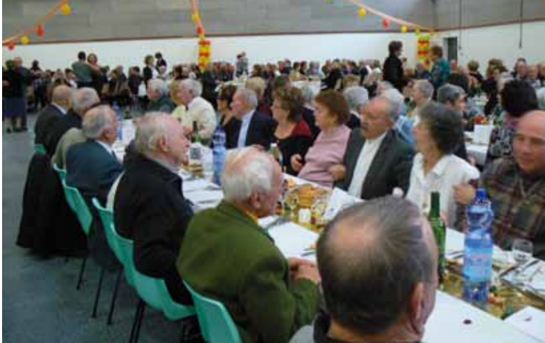
Le banquet des aînés en 2010

Il n'y a pas d'âge pour faire la fête et comme tout un chacun, les aînés de Nieul-sur-Mer aiment partager des moments festifs. Plusieurs temps forts permettent aux séniors de se retrouver tout au long de l'année.