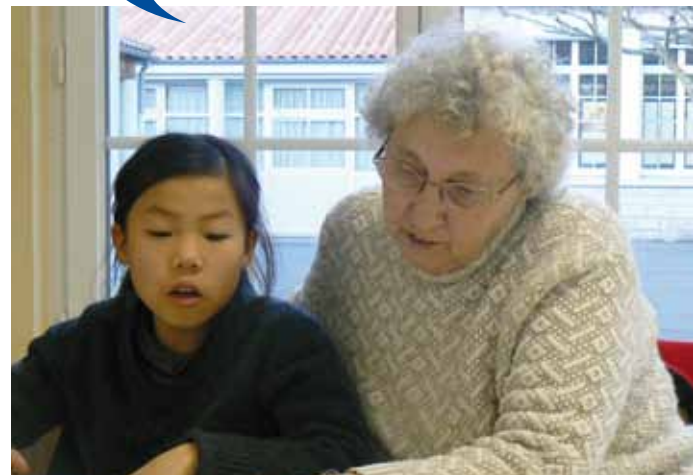
L'aide aux leçons à l'école Chobelet

Comme toutes les communes, Nieul-sur-Mer a besoin de bénévoles pour dynamiser la vie locale. Très actifs, ce sont bien souvent nos « anciens » qui composent cette armée de bénévoles.