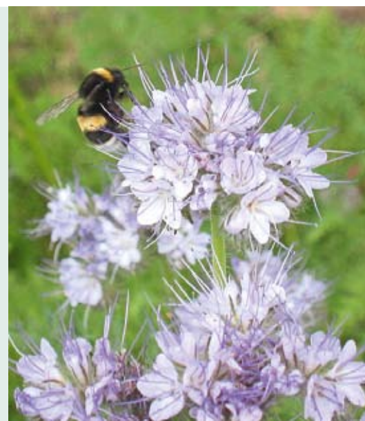
Fleur de phacélie

Ceux sont des plantes à croissance rapide, cultivées pour améliorer les sols. En les couvrant, elles protègent le sol et se substituent aux mauvaises herbes, sans compter que généralement mellifères, elles attirent les insectes butineurs. Une fois fauchées, on les enfouit dans la terre. Ainsi, elles drainent le sol et le fertilisent naturellement. En se décomposant, les engrais verts vont donc enrichir le sol en azote et en matières organiques. Moutarde, trèfle, seigle, sarrasin, phacélie, pois... Autant d'engrais verts qui seront les amis du jardinier écolo ! Voilà donc une façon écologique et économique de fertiliser son sol, sans impacter sur l'environnement ! Ils sont à semer de préférence entre fin août et septembre et à ensevelir après floraison avant que la graine ne monte. Vos plantes seront ainsi soignées et fortifiées, naturellement ! ♦