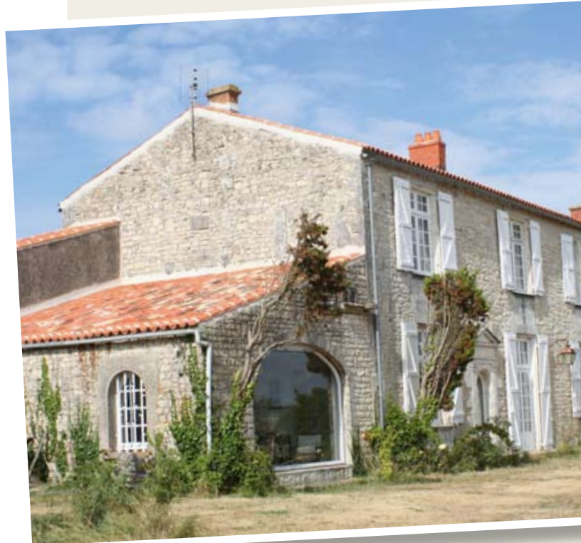
Vue sur la façade Sud. Le mur nord côté mer, aujourd'hui percé de fenêtres, était au Moyen-âge totalement aveugle, pirates oblige.

Jusqu'à la Révolution. Les biens des nobles étant confisqués, le domaine est mis sous scellés et son propriétaire, Monsieur Maussabré, est interné à Brouage. Les biens