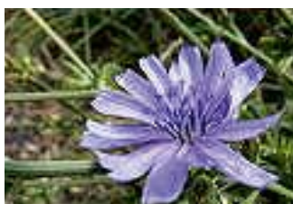
La fleur de la chicorée sauvage

Cette démarche s'accompagne de réunions d'information des habitants et d'actions de sensibilisation au jardinage sans pesticide pour que la démarche de réduction des produits chimiques ne se limite pas aux espaces publics entretenus par la commune.