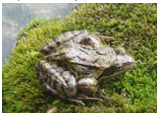
La grenouille est un anti-limace écologique