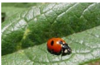
La coccinelle est l'anti-puceron préféré des jardins écologiques