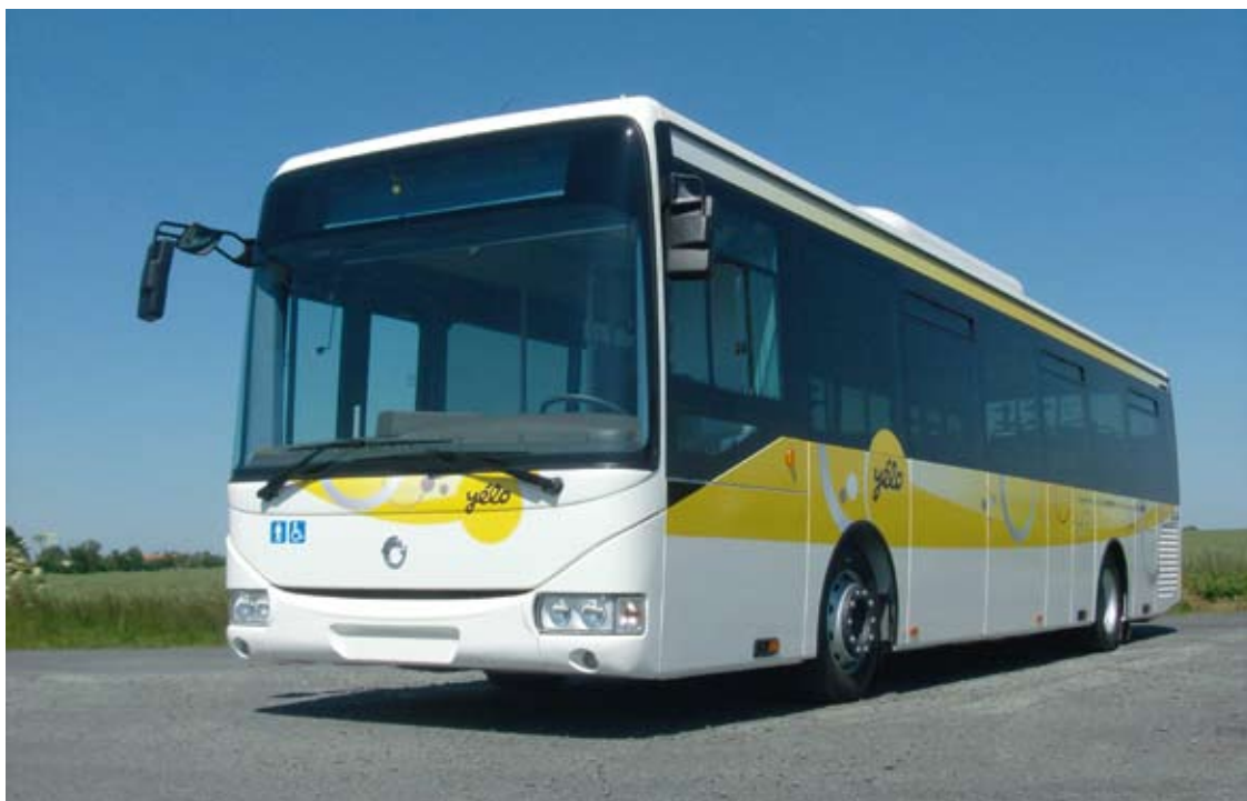
Les nouveaux bus Yélo

25 allers-retours par jour 6 jours sur 7 et toute l'année