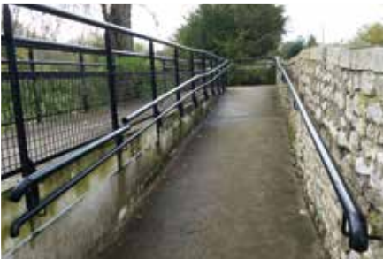
Rampe d'accès à la mairie.

La commission communale d'accessibilité a été saisie du dossier de mise en œuvre de notre ADAP et de de son suivi (trois réunions se sont déroulées en 2015). Puis, dans une démarche volontariste, elle a proposé une programmation pluriannuelle de travaux sur 3 ans à compter de 2016.