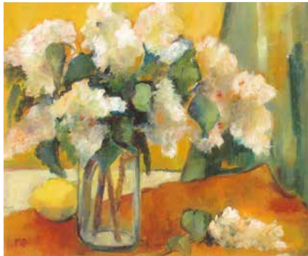
Une œuvre de Monique Van Beveren