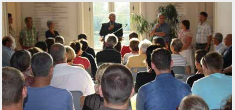
Discours du Maire à l'occasion de la soirée d'accueil des nouveaux Nieulais