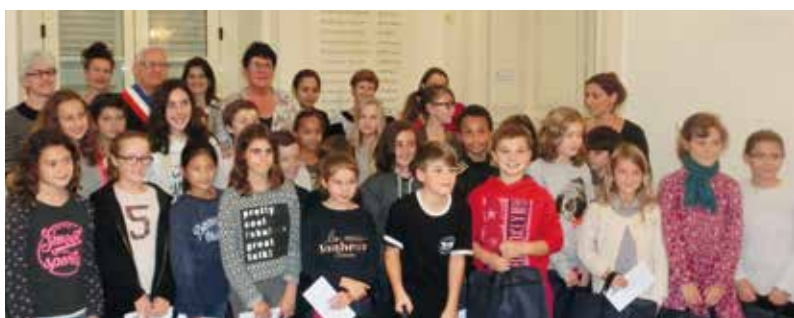
Election du Conseil d'Enfants le 16 octobre 2015.