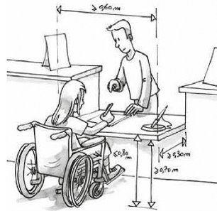
Exemple de mise en conformité pour l'accueil.

Il permet ainsi de proroger l'obligation de mise en conformité avec un engagement ferme de réalisation sur une durée encadrée de 3 à 6 ans selon le classement de l'établissement.