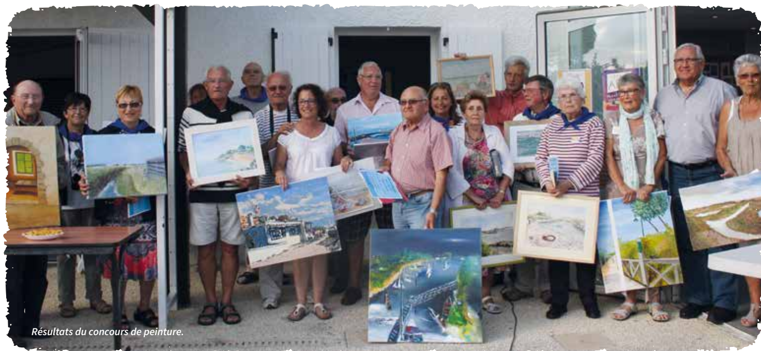
Résultats du concours de peinture.