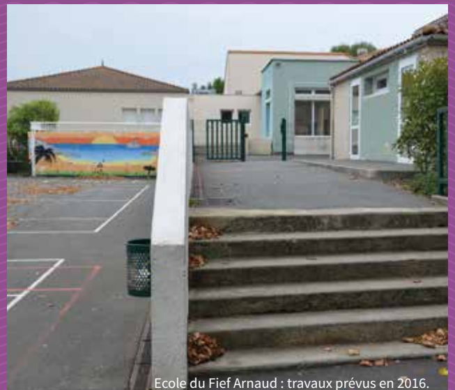
Ecole du Fief Arnaud : travaux prévus en 2016.

Ce qui représente un montant global pour les travaux de 540 000 € en autofinancement communal.