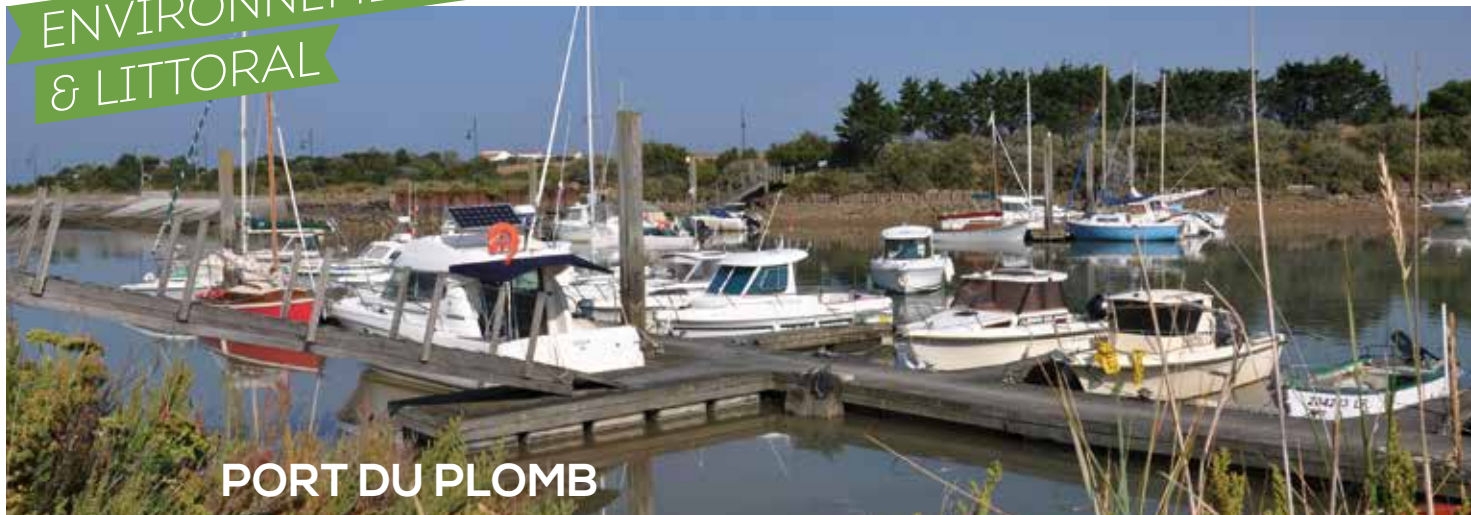
PORT DU PLOMB