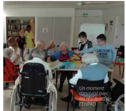
Un moment convivial avec les résidents de l'EHPAD

Sujet d'actualité pour la commission Environnement qui a organisé le 29 juin un rallye éco-citoyen dans le parc municipal Gabriel Chobelet. Ce projet, ouvert à tous et gratuit, tendait à faire découvrir au public comment devenir un bon éco-citoyen. De façon ludique et dans la bonne humeur, des ateliers étaient proposés pour découvrir le recyclage, comment faire un bon compost, avec l'association Éco Clic Eau. Le goûter bio proposé à tous a permis de remettre à chacun le diplôme du bon éco-citoyen, en souhaitant que les découvertes faites puissent perdurer au-delà des jeux.