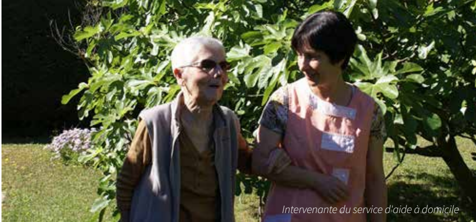
Intervenante du service d'aide à domicile