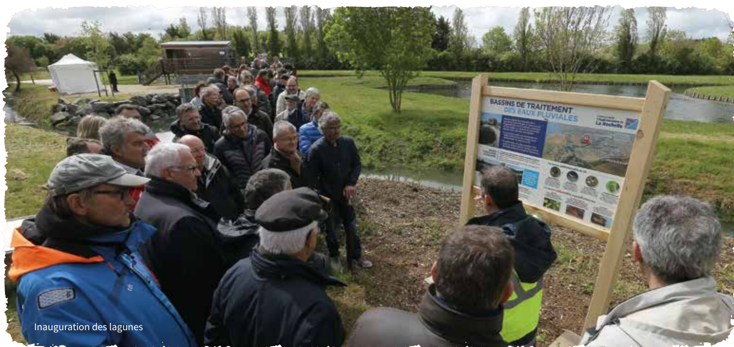
Inauguration des lagunes