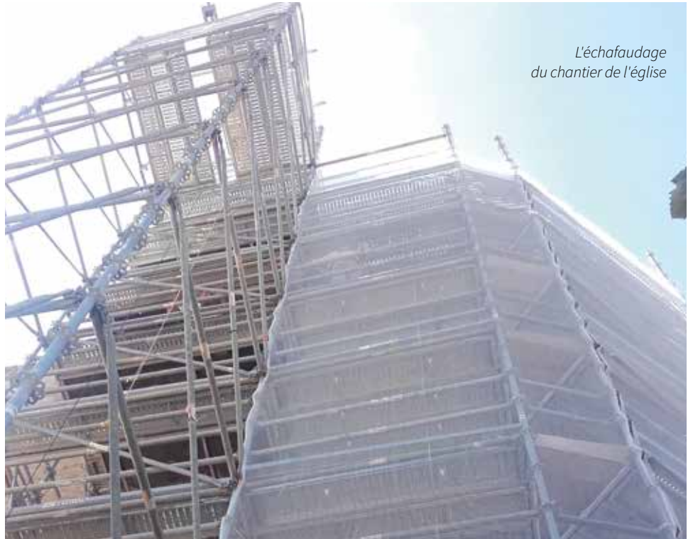
L'échafaudage du chantier de l'église

Les travaux ont commencé début juillet à l'église Saint-Philbert où les échafaudages, intérieurs et extérieurs, ont été installés. Une armure métallique qui abrite et protège le travail initié par les Compagnons de Saint-Jacques, en charge des travaux de maçonnerie. Le chantier, ouvert momentanément au public et aux donateurs le 16 septembre, dans le cadre des Journées du Patrimoine, il accueillera prochainement les enfants du CM1 et CM2 de la commune pour une découverte de ce grand clocher, mais aussi du travail des tailleurs. Des panneaux explicatifs installés dans l'église permettent à tout public intéressé de venir découvrir le pourquoi et le comment de ces travaux. D'autres actions de découverte seront menées d'ici la fin des travaux.