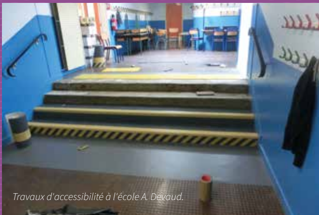
Travaux d'accessibilité à l'école A. Devaud.