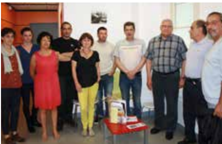
Le maire entouré des membres de l'association

COHESION 17 est une association rochelaise chargée de l'insertion socioprofessionnelle des chômeurs de longue durée. Elle a pour mission de rapprocher les demandeurs d'emploi des entreprises et particuliers à la recherche de main-d'œuvre pour assurer des services tels que le ménage, le repassage, le jardinage, le petit bricolage ou encore la manutention.