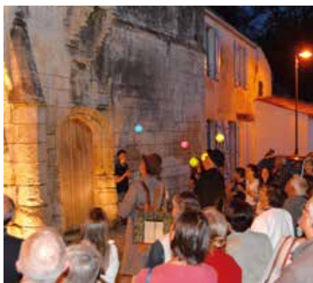
L'association a fait un don de 1000€ pour la rénovation du clocher et la Municipalité l'en remercie chaleureusement

+ | Pour plus de renseignements Contact : nieulauthentique.canalblog.com Tél. : 06 01 73 75 39