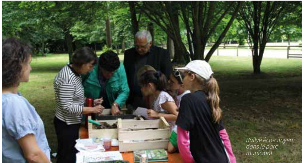
Rallye éco-citoyen dans le parc municipal