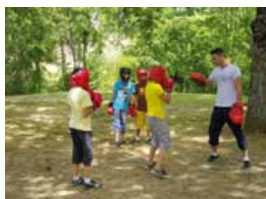
En juillet, les enfants ont pu suivre un stage de boxe à La Rochelle

Figurant parmi les priorités du mandat, l'action de l'équipe municipale en matière d'éducation représente l'un des plus gros budgets de la commune et implique plus de 25 agents.