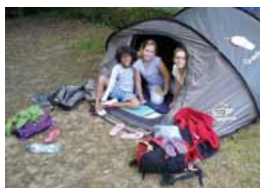
Minicamp de Marans: la «tente des filles»