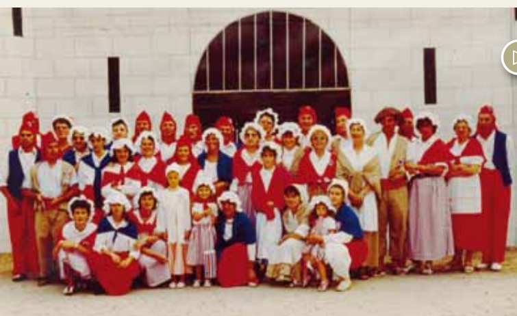
En juillet 1989, à l'occasion du bicentenaire de la Révolution, les membres du Comité s'étaient parés de costumes « sans-culotte ». Le même jour, un cracheur de feu avait été recruté pour brûler la Bastille. Malheureusement à l'heure dite, l'artiste était bien trop « fatigué » pour remplir sa tâche !

A.P : Nous vous donnons rendez-vous le samedi 13 novembre à 20h00 à l'espace Michel Crépeau pour une grande soirée « inhabituelle ». On compte sur vous !