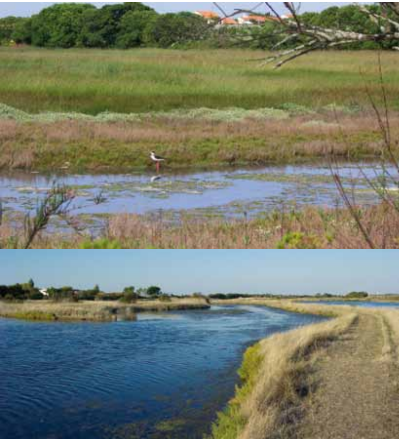
Le marais est un site remarquable pour sa faune et sa flore. En haut une échasse blanche.