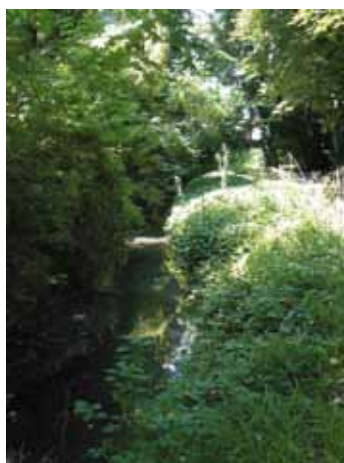
Le Gô s'offre une pause à l'ombre des arbres du parc.

Suite aux inondations de 2000, les riverains du Gô s'étaient regroupés en association afin de fédérer les actions à entreprendre pour assurer son entretien et garantir un écoulement normal du cours d'eau. La dernière tempête vient de nous rappeler à nouveau l'importance de cet entretien.