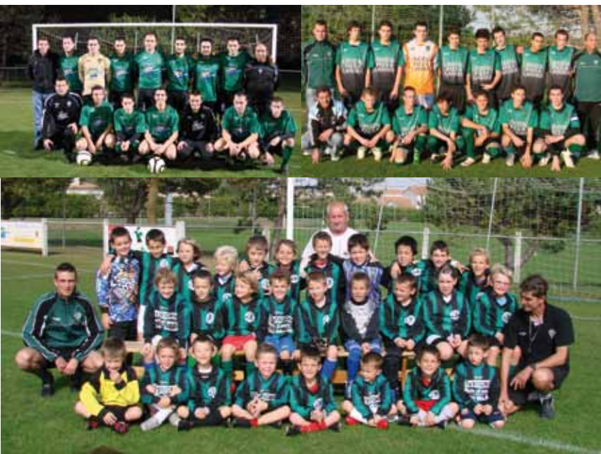
Trois « footos » : ...des plus jeunes en U7 aux seniors, 270 licenciés fous de foot...

L'ASM est aujourd'hui constituée de 13 équipes et compte 270 licenciés répartis des plus jeunes (en U7) aux seniors. Tous ont réalisé une belle, voire une très belle année, en commençant par l'équipe phare du club qui a su se hisser en 1 ère division et finir 4 e de sa poule.