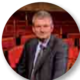
Monsieur Olivier Falorni, Député de la 1 ère circonscription de la Charente Maritime.

Rendez-vous par téléphone à l'accueil de la mairie : 05 46 37 40 10