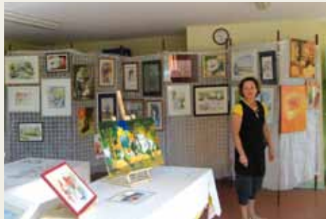
Exposition à la Maison des Associations

Merci à nos peintres locaux, dont l'accueil chaleureux et convivial a permis au public de s'imprégner de leur passion, et qui sait, peut être, de faire naître des vocations d'artistes.