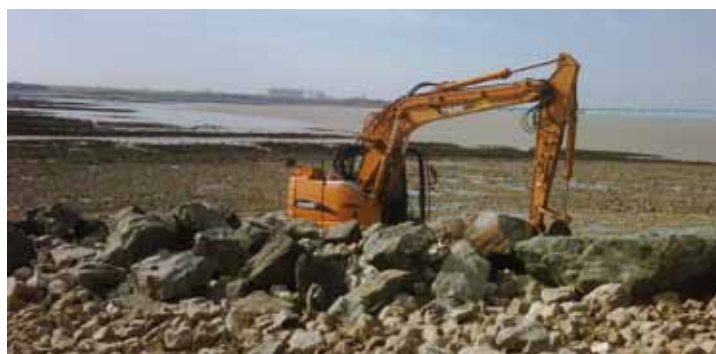
Comblement et remontée d'une ligne d'enrochement sur toute la longueur de la digue frontale du port du Plomb.

La tempête Xynthia a ravagé les territoires littoraux du département et a fortement endommagé les 225 kilomètres d'ouvrages protégeant les côtes charentaises contre l'océan. Dès les premières heures qui ont suivi la tempête, un travail de séquencage des travaux de réparation des protections a été engagé. Il en est ressorti une planification des interventions sur trois niveaux : Les interventions de première urgence (niveau 1 totalement réalisé aujourd'hui), les travaux de reprise ou de consolidation des ouvrages (niveau 2 également achevé) et enfin la rédaction d'un plan de prévention des submersions marines (niveau 3 dont la réflexion a débuté en novembre).