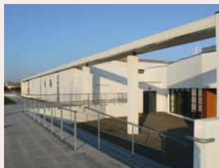
La commune met à disposition des familles une salle de l'Espace Michel Crépeau pour l'organisation des obsèques civiles

Règlement de mise à disposition de la salle consultable en mairie.