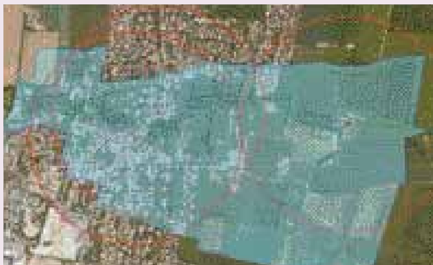
Sont protégés au titre des monuments historiques, le clocher de l'église Saint Philibert, le domaine du Portail et le prieuré de Sermaize.

Dans le cadre de la procédure de révision du Plan Local d'Urbanisme, une modification des périmètres a été proposée par le Service Départemental de l'Architecture et du Patrimoine (SDAP). Cette proposition intervient afin que les périmètres s'adaptent de façon plus étroite au champ de visibilité des monuments historiques situés sur le territoire de la commune. Après examen de la proposition du SDAP, la commune a validé le nouveau périmètre lors de la séance du conseil municipal du 15 septembre dernier. La modification sera soumise à enquête publique conjointement à celle du Plan Local d'Urbanisme.