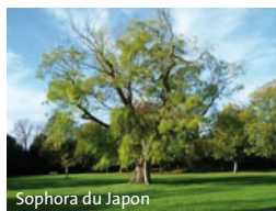
Sophora du Japon

Au cœur du village se trouve le parc municipal Gabriel Chobelet où l'on peut admirer un arbre rare classé comme remarquable : un sophora du Japon très ancien (le plus ancien de La Charente-Maritime) avec un tronc de 3,92 mètres de circonférence.