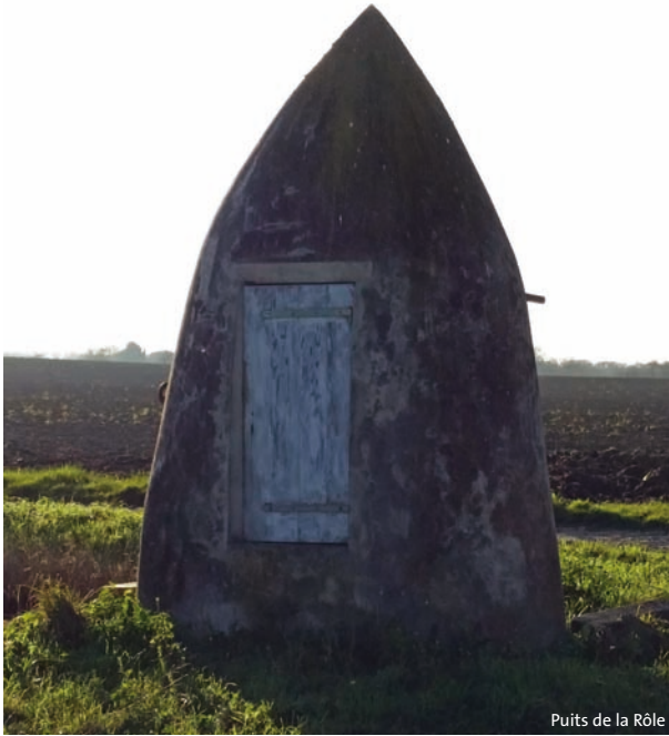
Puits de la Rôle