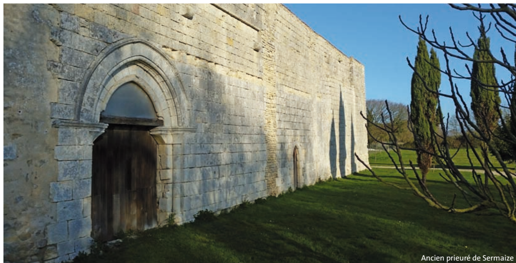
Ancien prieuré de Sermaize