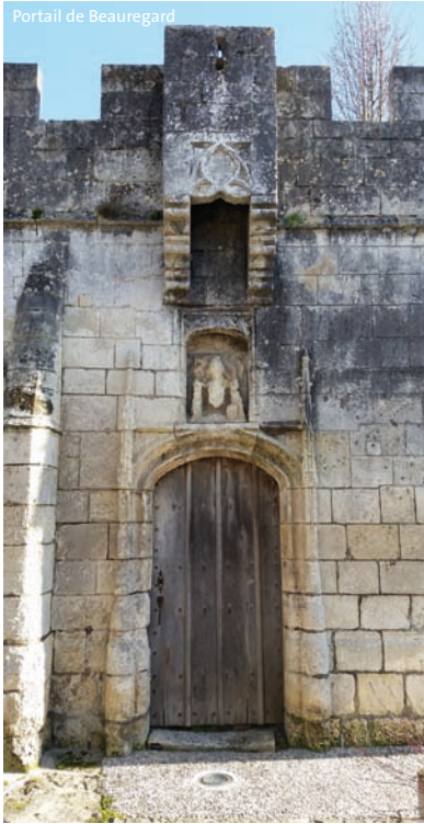
Portail de Beauregard