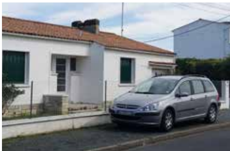
Les véhicules mal garés se verront apposés des « papillons d'information » afin de sensibiliser les conducteurs ; après les papillons, ce seront les « prunes ».

+ | Rens. police municipale - 05 46 37 40 10