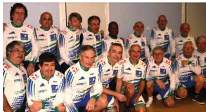
Au Vélocub nieulais, le sport juste pour le plaisir.

+ Rens. vcn@hotmail.com ou sur www.sport50.com/vcn17veloclubnieulais tél. 05 46 56 20 97