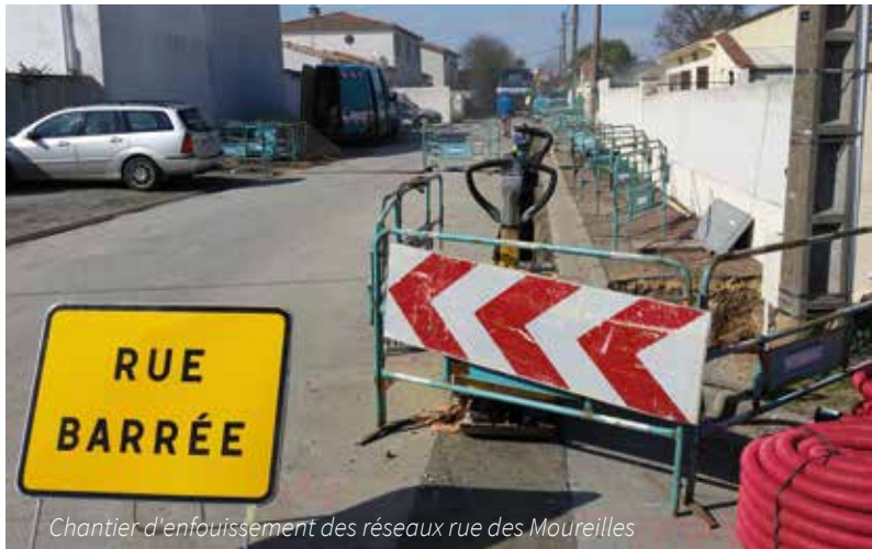
Chantier d'enfouissement des réseaux rue des Moureilles

Ces investissements s'associent à des opérations de mise en sécurité des voies de circulation notamment par la mise en accessibilité des passages piétons et la pose de mobilier de sécurité aux abords des intersections.