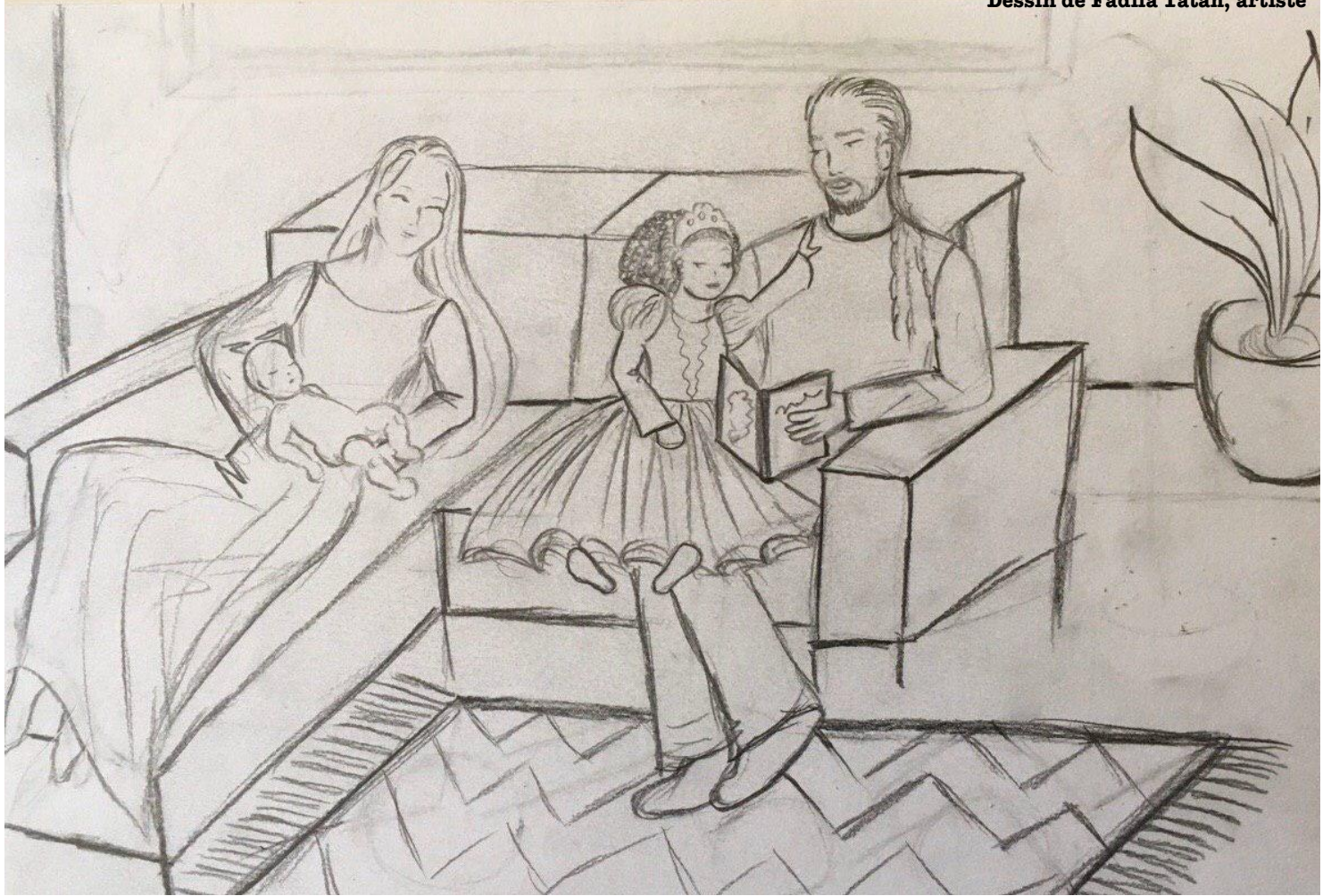
Dessin de Fadila Tatab, artiste